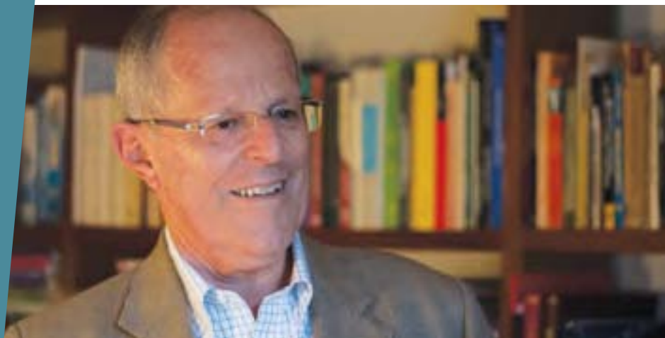
Pedro Pablo Kuczynski Godard Presidente del Consejo de Ministros, agosto 2005 - julio 2006

“Junto con la educación, no hay duda que una mejora en la reducción de la pobreza en las zonas rurales del Perú es la gran prioridad que tenemos por delante”.