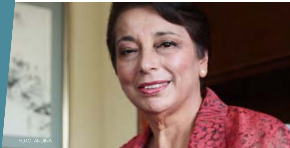
Beatriz Merino Lucero Presidenta del Consejo de Ministros, junio a diciembre 2003