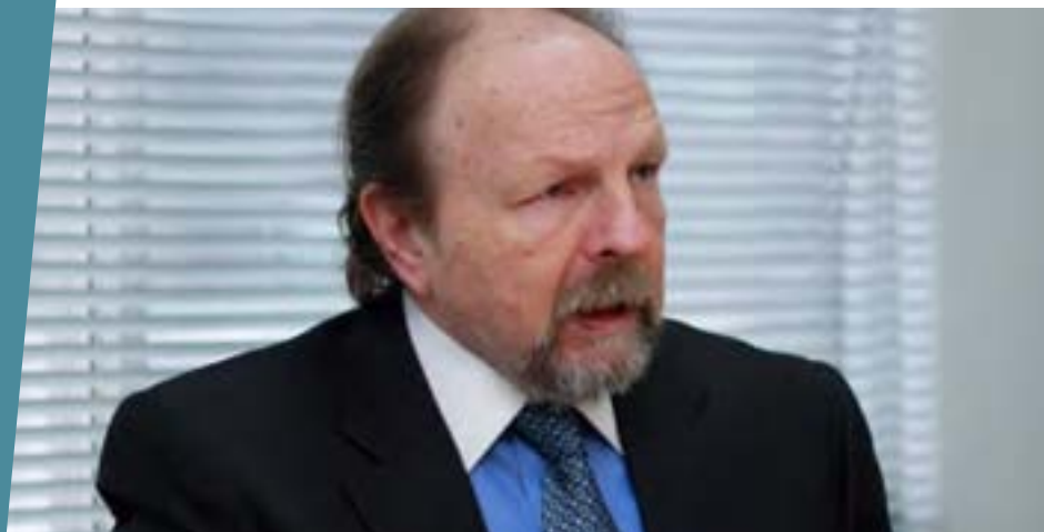
Salomón Lerner Ghitis Presidente del Consejo de Ministros, julio a diciembre 2011

“...consideramos que el Acuerdo Nacional es un Foro importante que debe mantenerse y fortalecerse en aras de que se siga consolidando el diálogo y el consenso entre todas las fuerzas políticas y sociales que crean en la democracia y la gobernabilidad en el país”.