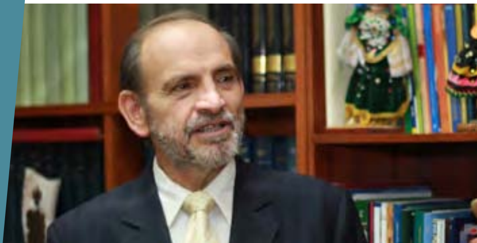
Yehude Simon Munaro Presidente del Consejo de Ministros, octubre 2008 - julio 2009

“El Acuerdo Nacional fue el marco dentro del cual se desarrolló mi gestión. La visión de Estado permite actuar sin improvisación. La acción en el marco de políticas consensuadas facilita la gobernabilidad y fortalece a la república”.