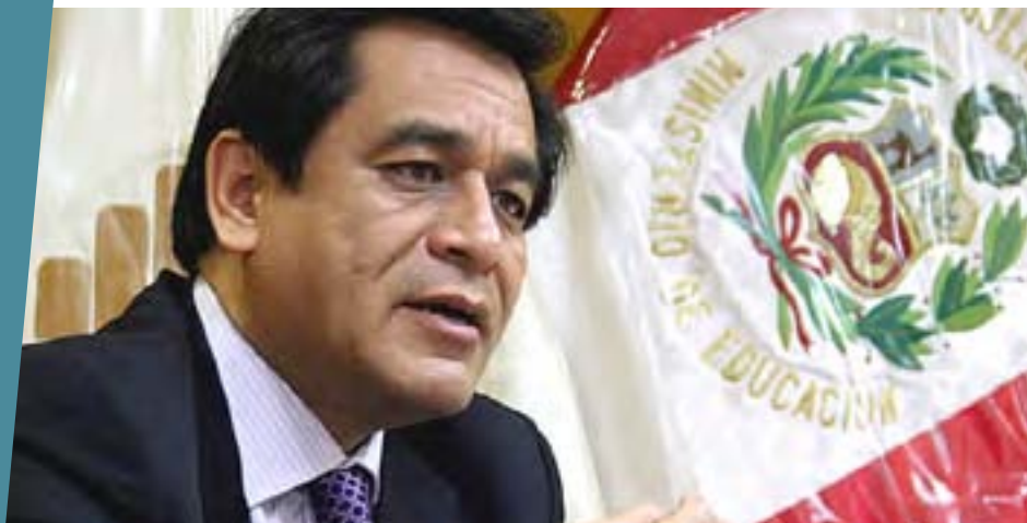
José Antonio Chang Escobedo Presidente del Consejo de Ministros, setiembre 2010 - marzo 2011

“Durante mi gestión como Ministro de Educación, se reconoció el ‘Proyecto Educativo Nacional (PEN) al 2021’, que desarrolla la décimo segunda política de Estado del Acuerdo Nacional y que asegura la continuidad de las políticas de Estado, más allá de las diferentes administraciones del sector educativo”.