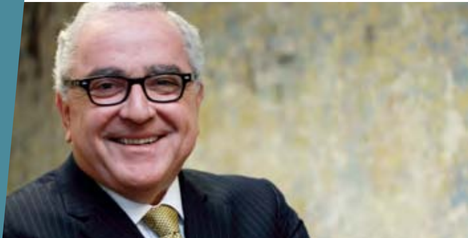
Roberto Dañino Zapata Presidente del Consejo de Ministros, julio 2001 - julio 2002

"... ¿Porqué no soñar con un país en el que toda persona, en cada comunidad, tenga las condiciones para un desarrollo pleno de sus capacidades en un ambiente equilibrado y justo, un país en el que toda niña y todo niño que nazca pueda tener una vida sana, productiva, creativa y libre?"