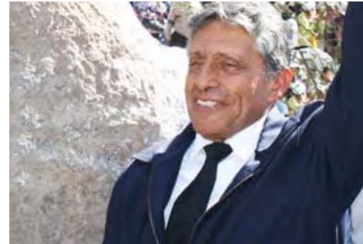
Juan Manuel Guillén Benavides Presidente del Gobierno Regional Arequipa, enero 2007 - a la fecha

En aplicación de las políticas consagradas en el Acuerdo Nacional, el Gobierno Regional de Arequipa (GRA) viene gestando un nuevo pacto social y de gobierno con la población arequipeña al que hemos denominado "cogobierno". Este "pacto" se basa en la consolidación del Estado democrático, estableciendo una nítida separación de poderes entre el órgano ejecutivo regional y el ente legislativo-fiscalizador (Consejo Regional); en el respeto irrestricto del Estado de derecho; y en la participación directa de la población en la solución de sus problemas, interviniendo activamente en la ejecución de los proyectos de infraestructura de servicios básicos. A la vez, se fortalece un Estado más eficiente, dinámico y más transparente.