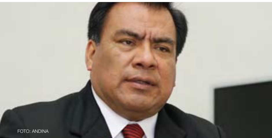
Javier Velásquez Quesquén Presidente del Consejo de Ministros, julio 2009 - setiembre 2010