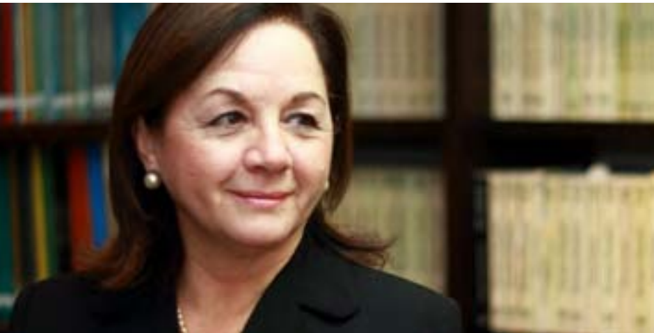
Rosario Fernández Figueroa Presidenta del Consejo de Ministros, marzo a julio 2011

“Un elemento importante que resalta el Acuerdo Nacional es contar con un Estado eficiente, eficaz, moderno y transparente al servicio de las personas y de sus derechos, y que promueva el desarrollo y buen funcionamiento del mercado y de los servicios públicos”.