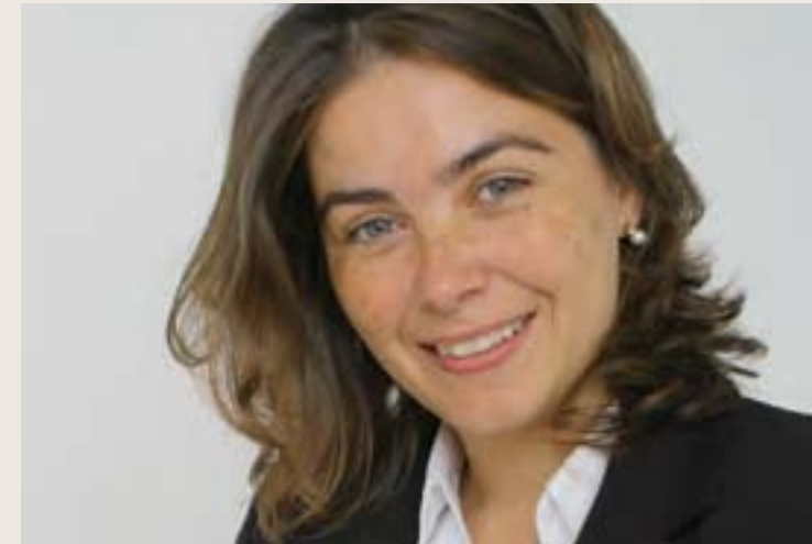
Lucía Dammert Guardia Especialista internacional en seguridad ciudadana

El Acuerdo Nacional (AN) es posiblemente la única forma para diseñar e implementar políticas desde una perspectiva de ciudadanía y convivencia en las políticas sociales en general y de seguridad ciudadana en particular. Las políticas de Estado, consensuadas con los diversos actores, es un requisito para el logro de metas efectivas en la compleja tarea de impactar sobre percepciones, comportamientos y actitudes. En los últimos años el AN ha puesto énfasis en la generación de estos espacios de diálogo así como de concertación de ideas y propuestas vinculadas con la prevención de la violencia y el aumento de la seguridad. El AN, además, ha logrado incluir muchos de los temas vinculados con las causas mismas de la violencia y la inseguridad en múltiples otras políticas de Estado generando así sinergias positivas en áreas que requieren de una fuerte intervención integral y multidimensional.