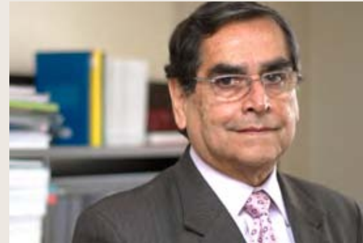
Óscar Ugarte Ubilluz Ministro de Salud, octubre 2008 - julio 2011 Presidente del Consejo Directivo del Sistema Metropolitano de la Solidaridad (SISOL)

Luego de 11 años de aprobado el Acuerdo Nacional y de 7 años de vigencia del Acuerdo de los Partidos Políticos en Salud, es posible constatar avances importantes y también limitaciones que se convierten en grandes desafíos a encarar en el corto, mediano y largo plazo.