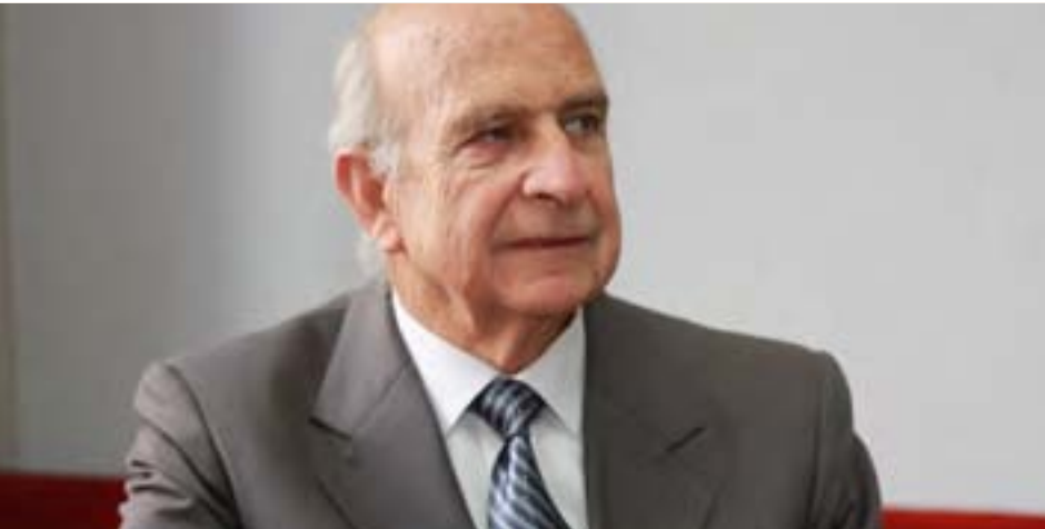
Carlos Ferrero Costa Presidente del Consejo de Ministros, diciembre 2003 - agosto 2005

“El Acuerdo Nacional (AN) es, sin duda, un organismo que contribuye a la gobernabilidad porque ofrece un espacio para el diálogo entre el gobierno, los partidos políticos y la sociedad civil sin el apasionamiento y la competencia que, por ejemplo, tiene el debate parlamentario”.