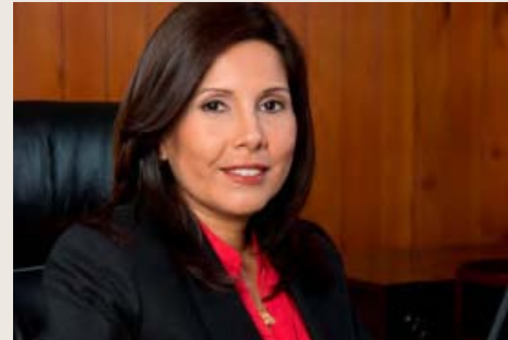
Tania Quispe Mansilla Superintendente Nacional de Administración Tributaria

La Superintendencia Nacional de Administración Tributaria (SUNAT), como institución pública descentralizada responsable de promover en el país el cumplimiento tributario y aduanero, trabaja activamente en la aplicación de esta política de Estado orientada a la eliminación de prácticas violatorias del orden jurídico como la evasión tributaria, el contrabando y, recientemente, la minería ilegal y el narcotráfico.