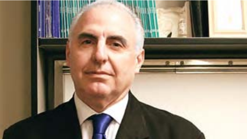
Luis Solari de la Fuente Presidente del Consejo de Ministros, julio 2002 - junio 2003

“Era necesario crear nuevos modos de relación entre las organizaciones políticas y las sociales, utilizando el trabajo conjunto como un método para construir una nueva confianza, basada en la búsqueda de lo bueno para todos”.