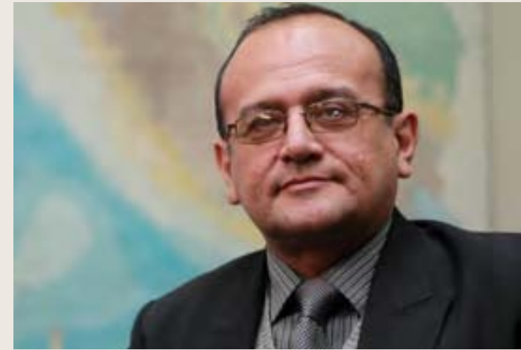
José Robles Montoya Director General de Política y Estrategia del Ministerio de Defensa (MINDEF)

El Acuerdo Nacional constituye la mayor expresión de madurez política de nuestra sociedad, convirtiéndose en espacio de reflexión basado en la búsqueda de un país más justo y más inclusivo que permita alcanzar el bienestar general.