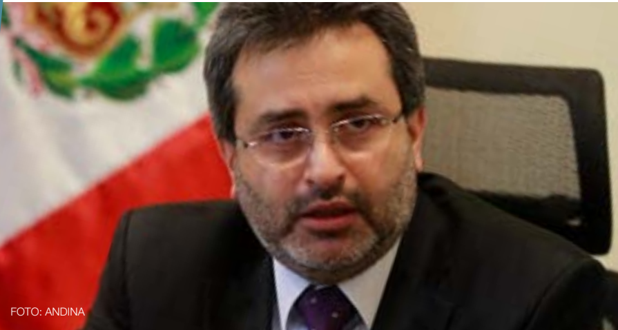
Juan Jiménez Mayor Presidente del Consejo de Ministros, julio 2012 - octubre 2013