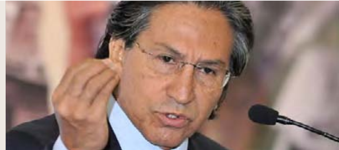
Alejandro Toledo Manrique Presidente de la República del Perú, periodo 2001 - 2006 Presidente del Acuerdo Nacional, 2002 - 2006

empieza hoy, sino ayer. Todos los proyectos de ley del Congreso de la República tienen ahora como fundamento de su propuesta el estar alineados con alguna de las políticas del Acuerdo Nacional. Quizás lo que está faltando es el camino inverso: las políticas de Estado en normas o instrumentos de gestión del Estado que generen no solo crecimiento económico sostenido y desarrollo sustentable, sino que se reflejen en beneficios tangibles, concretos y medibles para todos los peruanos, sin distinción, comenzando con los más pobres y excluidos. Hoy, el Acuerdo Nacional sirve también de marco para los planes de gobierno que cada cinco años ofrecen los partidos políticos al pueblo peruano. Esto debiera ser de aquí en adelante un requisito para participar en las contiendas electorales: suscribir el Acuerdo Nacional, no con el afán de sumar el respaldo de organizaciones políticas fragmentadas, sino con el espíritu de nuclear espacios de coincidencias con miras a que quien sea elegido por el pueblo tenga claro hacia dónde conducir esta “gran nave” que es nuestro Perú. Camino se hace al andar. Pero mejor si se hace con rumbo definido y visión de futuro.