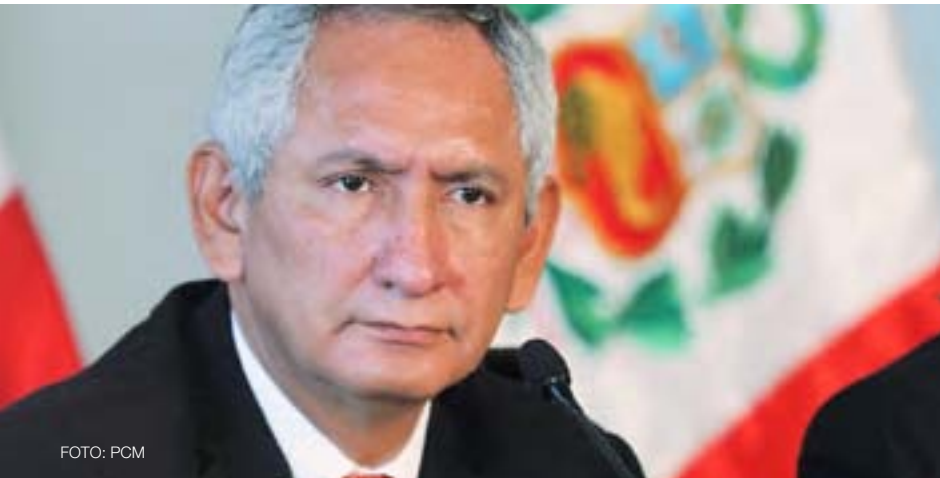
René Cornejo Díaz Presidente del Consejo de Ministros