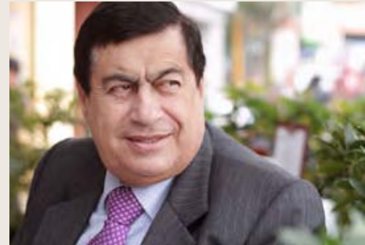
Fausto Alvarado Dodero Diputado de la República, julio 1990 - abril 1992 Congresista de la República, julio 2001 - julio 2006 Ministro de Justicia, julio 2002 - febrero 2004 Representante del Frente Independiente Moralizador en el Acuerdo Nacional, marzo 2002 - julio 2006

El Acuerdo Nacional ha consolidado una oportuna distinción, y por consiguiente definición, entre dos conceptos fundamentales para la buena y eficiente práctica del poder: las políticas de gobierno y las políticas de Estado. Delimitando su campo dentro de la semántica política, las primeras comprenden a las acciones del apoderado político de turno, y las segundas, acaso más importantes, a aquellas que trascienden la temporalidad del mandato, con planes y programas que no dependan de los humores ni correlatos políticos, que no deben condicionar el futuro del país, sino por el contrario, darle una perspectiva para lograr una sociedad justa, constituyendo una guía de navegación hacia ese objetivo. Creo que éste, en términos generales, es el mayor aporte del Acuerdo Nacional.