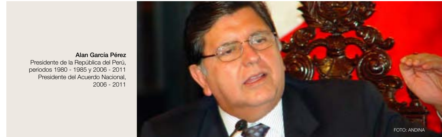
Alan García Pérez Presidente de la República del Perú, periodos 1980 - 1985 y 2006 - 2011 Presidente del Acuerdo Nacional, 2006 - 2011

Otro aspecto que se ha recogido de las políticas consensuadas fue la promoción de una reforma educativa que priorizó la capacitación del docente y la meritocracia en la carrera pública magisterial, hoy penosamente trunca. En todo caso, con orgullo vemos cómo en algunas regiones del país abolimos el analfabetismo y, en general, lo redujimos