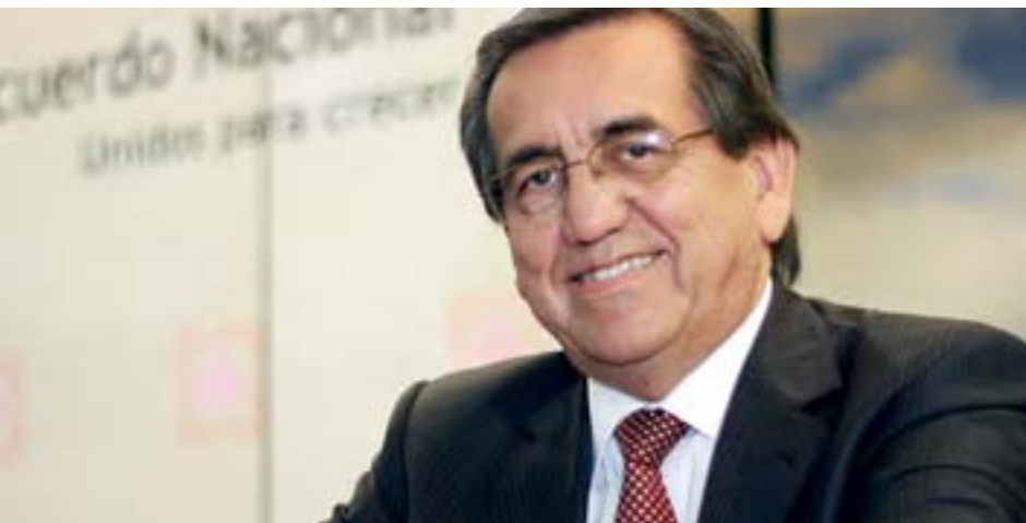
Jorge del Castillo Gálvez Presidente del Consejo de Ministros, julio 2006 - octubre 2008

“...nuestra toma de decisiones se basaba en dos pilares: el desarrollo humano y el desarrollo económico , uno retroalimentando al otro; y para ello utilizamos algunos instrumentos sin duda inspirados en la propia metodología del Acuerdo Nacional, como son: a) Diálogo y concertación; b) Confianza; c) Trato equitativo, y d) Justicia social”.