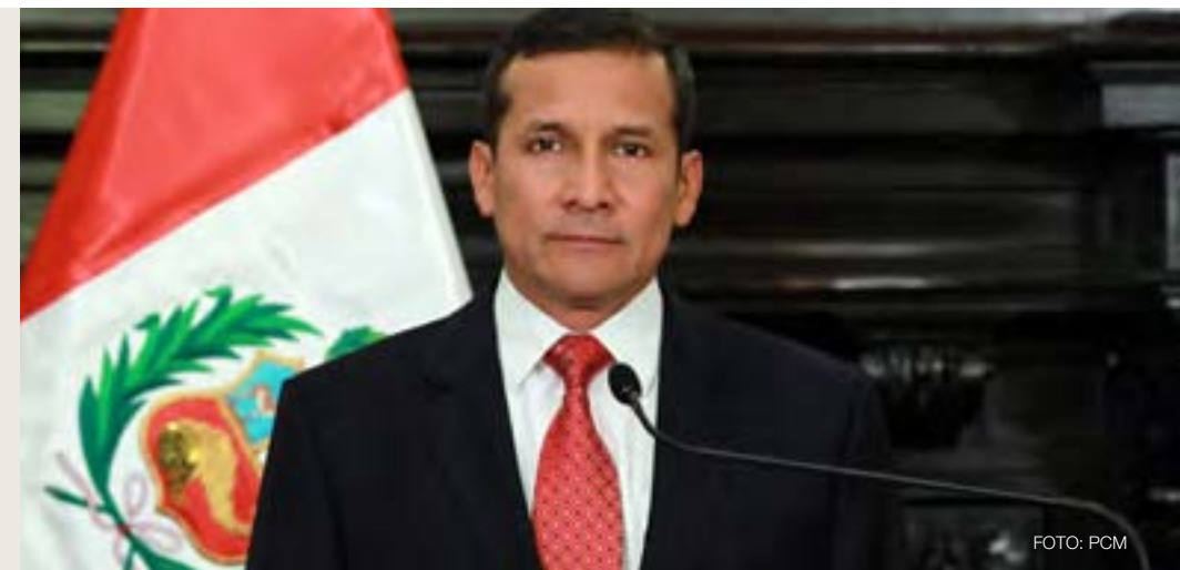
Ollanta Humala Tasso Presidente de la República del Perú Presidente del Foro del Acuerdo Nacional

Este es un avance de enorme trascendencia, porque el Perú ha vivido de espaldas a su geografía, configurando a lo largo de su historia un conjunto de desequilibrios que, además de situaciones de exclusión y abandono, generaron fracturas territoriales,