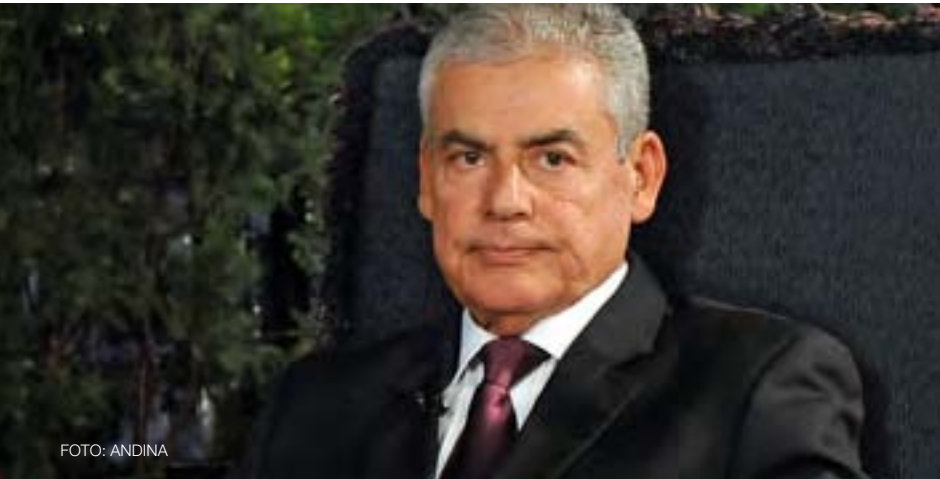
César Villanueva Arévalo Presidente del Consejo de Ministros, octubre 2013 - febrero 2014

“En casi dos siglos de vida republicana, el Foro del Acuerdo Nacional se ha consolidado como el esfuerzo deliberativo más importante del periodo, dirigido a la definición de un ideal compartido por todos los peruanos y peruanas”.